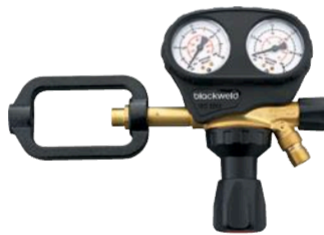
Acetylen 1,5/2,5 bar