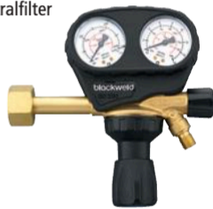
Sauerstoff 10/16 bar