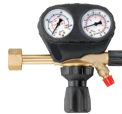
Argon/CO 2 30 Liter